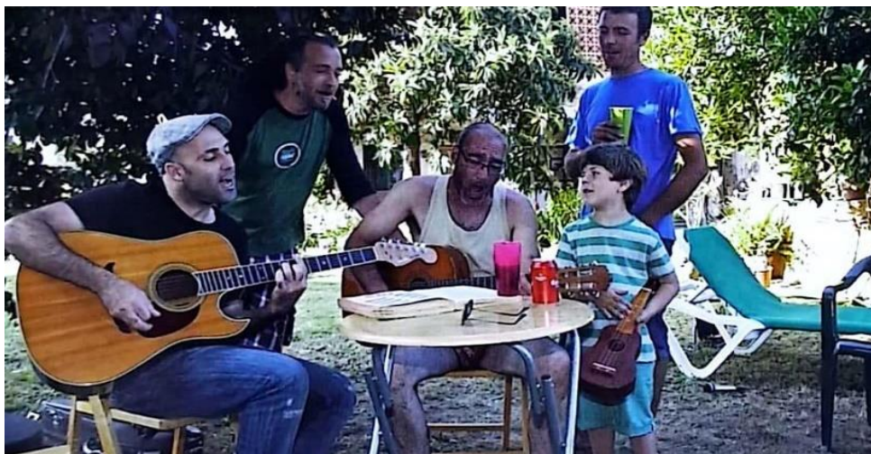
Ejemplo de fotografía: reunión de viejos amigos

El proyecto ofrece la ocasión del desarrollo personal y en grupos de estudiantes dando la chance de explotar el tema con la ayuda de la fotografía como inspiración y con la de las preguntas formuladas, preguntas que serán tantas oportunidades para usar el lenguaje para así producir mensajes escritos y orales en lengua española.